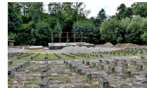
Začiatok prerábky amfiteátra na Štávcici