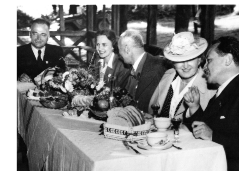
Benešovci a Clementisovci na Štávcici - s. 5