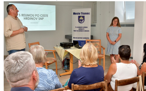
Leto v knižnici - beseda - s. 7