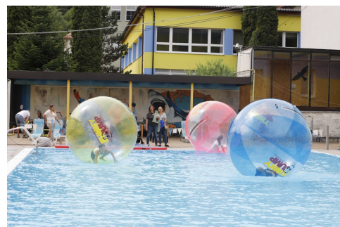
Leto v Tisovci - s. 3