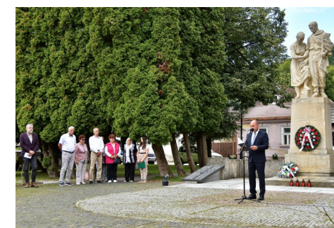
81. rokov SNP