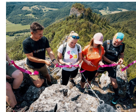
Strihanie pásky ferratky - s. 3