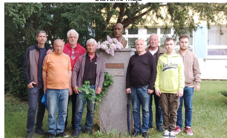
Samo Daxner - 170. výročie narodenia