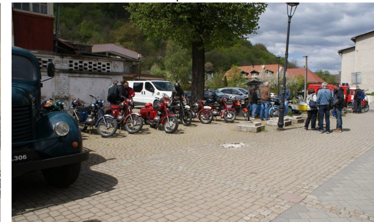
1. máj v Kôlničke a pred ňou