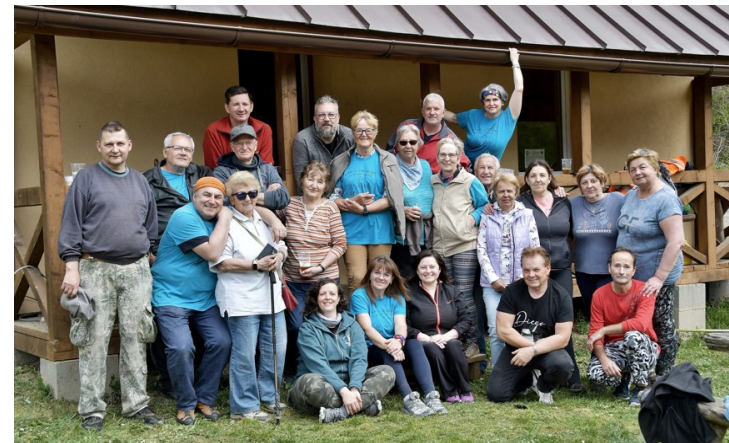
10 rokov TO KOS

Milí priatelia, nech je dnešná vatra symbolom úcty k minulosti, ale aj nádeje do budúcnosti. Nech nám pripomína, že mier, sloboda a vzájomná úcta sú hodnoty, o ktoré sa treba starať každý deň. Česť pamiatke všetkých obetí druhej svetovej vojny. Česť tým, ktorí bojovali za našu slobodu.