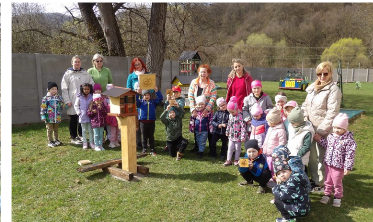
Apríl v MŠ