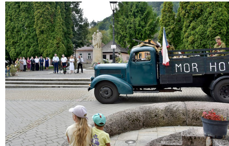
Pripomienka 80. výr. SNP 30.8.2024