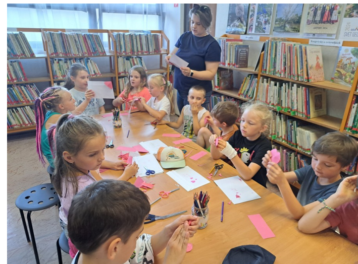
Leto v knižnici