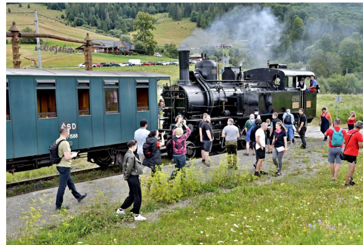
Skúšobná jazda parného rušňa po generálnej oprave