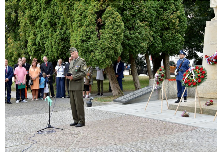
Pripomienka 80. výr. SNP 9.9.2024