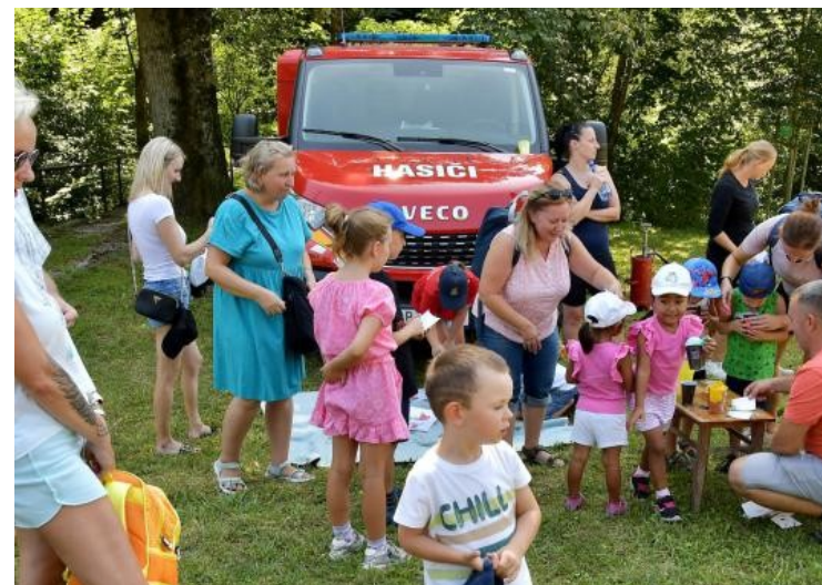
Leto na šťavici

MESTO TISOVEC, OBCE POHORELÁ, ZÁVADKA NAD HRONOM Vás srdečne pozývajú na spomienkové oslavy 122. výročia narodenia a 72. výročia úmrtia slovenského politika, právnik, spisovateľa – tisovského rodáka