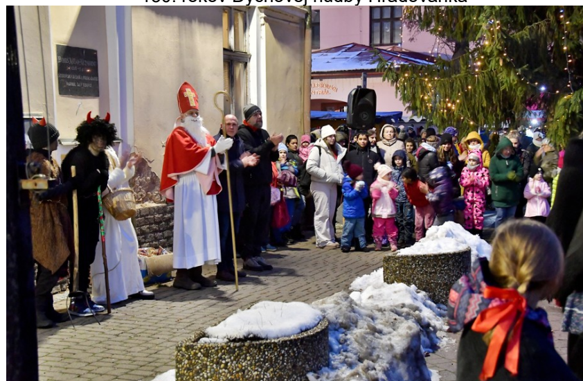
Mikulášske trhy a začatie vianočnej výzdoby