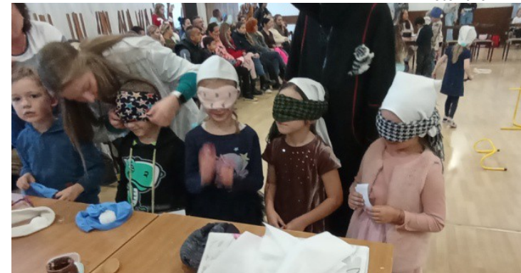
Pasovačka prvákov – ochutnávame chute