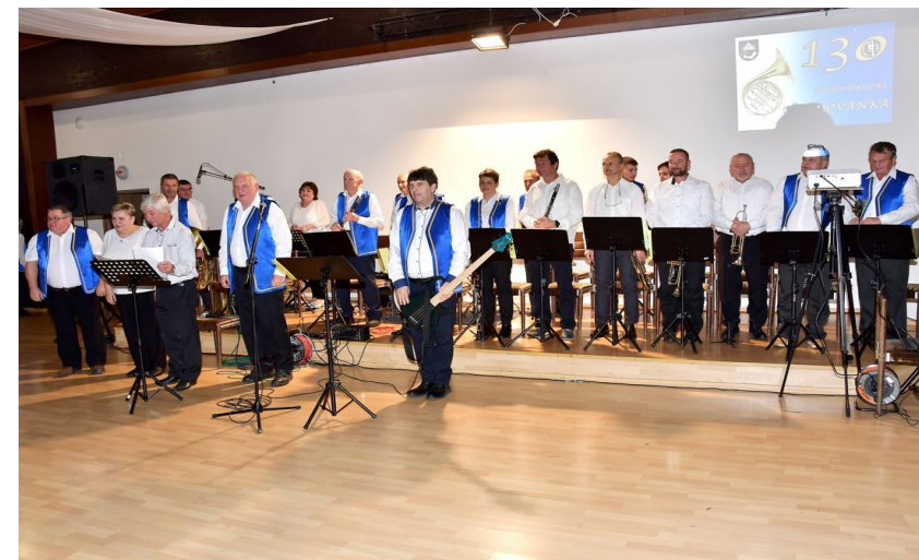
130. rokov Dychovej hudby Hradovanka