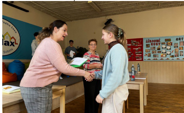
Lenkine 2. miesto