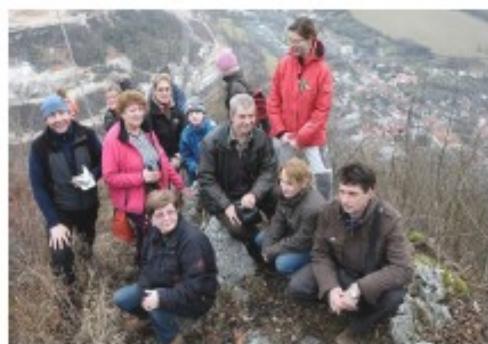
z víťania nového roka 2014

Zmesový komunálny odpad (bežný odpad z domácností) vhadzujte do vlastných kontajnerov a nádob, ktoré sú a aj v budúcom roku budú vyvážané po jednotlivých uliciach každý druhý týždeň a pri bytových domoch každý týždeň. Objemový odpad (skrine, posteľ, umývadlo...) a drobný stavebný odpad (materiál do 1 m 3 – výmena kachličiek, búranie tenkej priečky...) bude zberaný na budúci rok – 2014, prostredníctvom mobilného zberu.