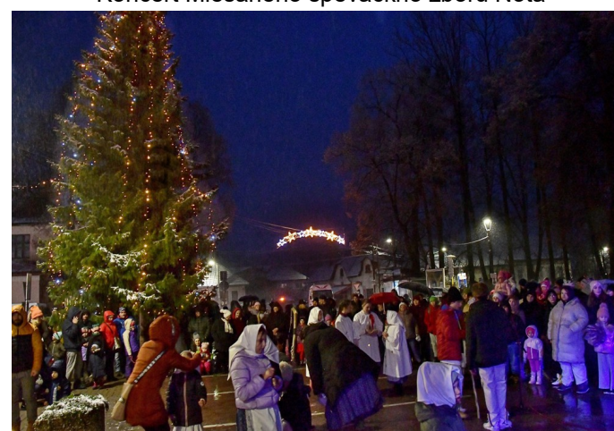
Mikulášske trhy a zapálenie vianočnej výzdoby mesta