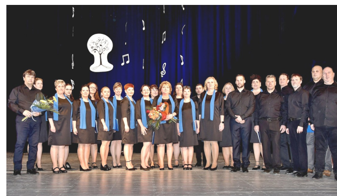
Koncert Miešaného speváckho zboru Nôta