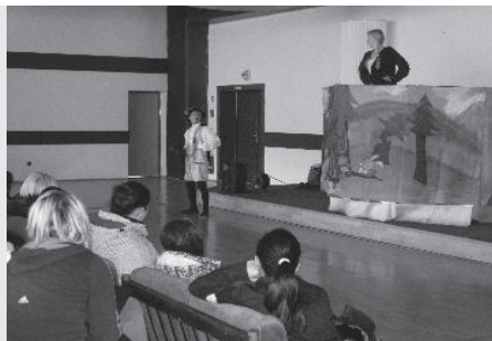
podtónom. Traja herci na otáčajúcej sa scéne

17. november je spájaný nielen s Dňom boja za slobodu a demokraciu, ale je to aj Medzinárodný deň študentov. Práve z tohto dôvodu sa vedenie tisovskej strednej odbornej školy rozhodlo dňa 16. novembra 2011 (deň pred štátnym sviatkom) nahradiť klasický výchovno-vzdelávací proces divadelným predstavením a výchovným koncertom a venovať ho všetkým študentom. Divadlo Clipperton sa predstavilo klasickou rozprávkou Popoluška (Tri oriešky pre Popolušku) v modernom prevedení s jemným humorným