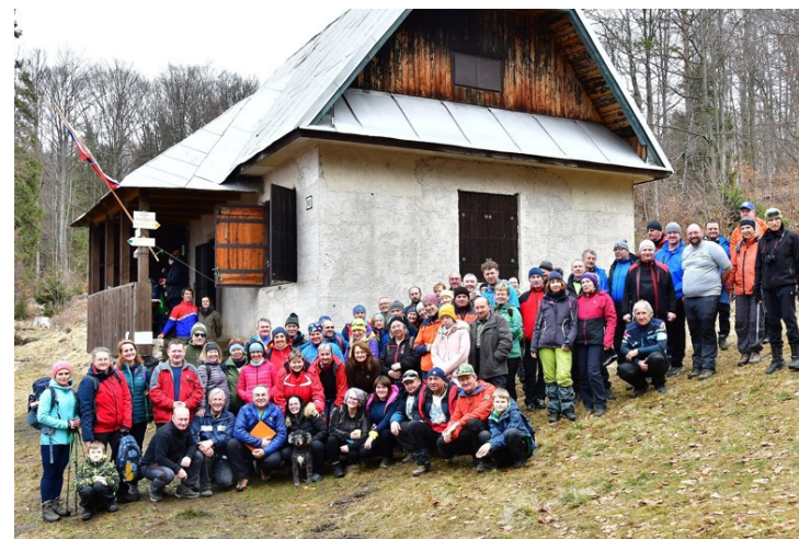
Účastníci výstupu na Trstie