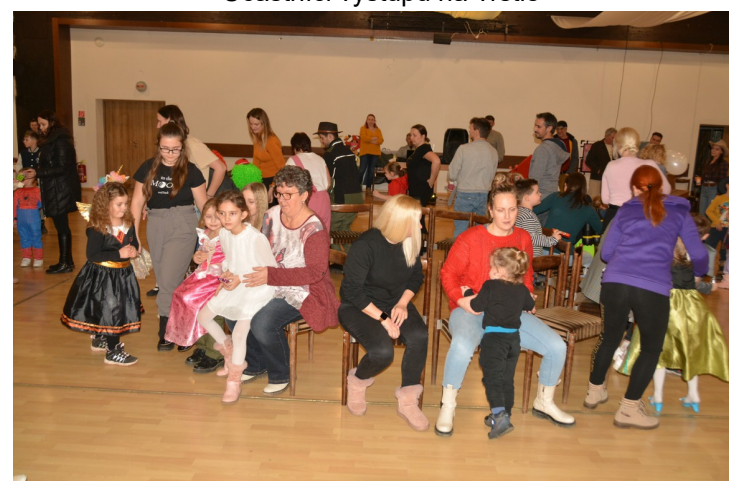
Fašiangový karneval MŠ