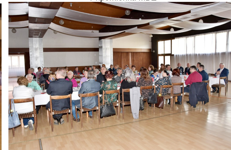
Výročná členská schôdza SZPB