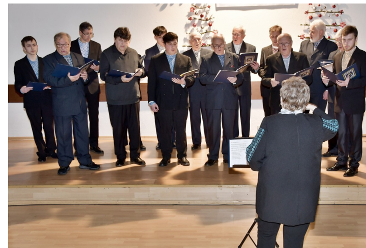
Daxnerov Tisovec hore: Mužský spevokol Dr. Samuela Daxnera, dole: Miešaný spevácky zbor Nôta