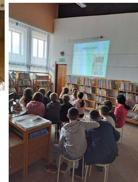
Marec v knižnici - knižnica v marci - s. 5