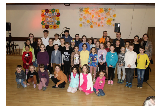
Na foto hore: Jarný koncert ZUŠ, dole: Koncert učiteľov ZUŠ - texty na s. 4