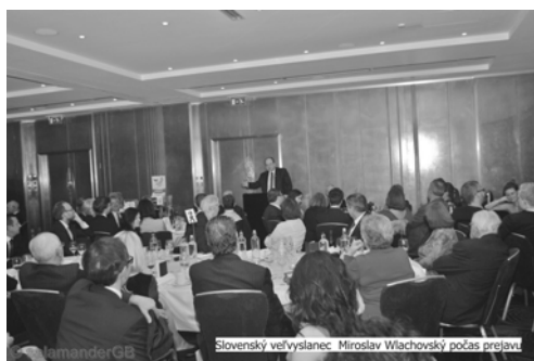
Slovenský veľvyslanec Miroslav Wlachovský počas prejavu