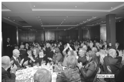
Pohľad do sály