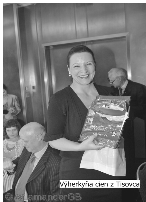
Výherkyňa cien z Tisovca