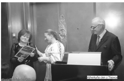
Výherkyňa cien z Tisovca