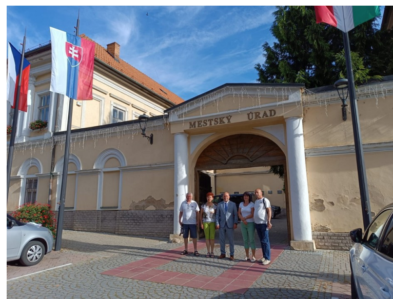
- delegácia z partnerskej obce Ludgefovice s primátorm mesta pred Radnicou