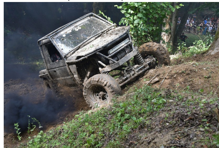
Off road Tisovec 2025 - trial v Dolinke