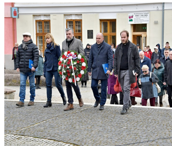
Pripomienka 78. výročia oslobodenia mesta