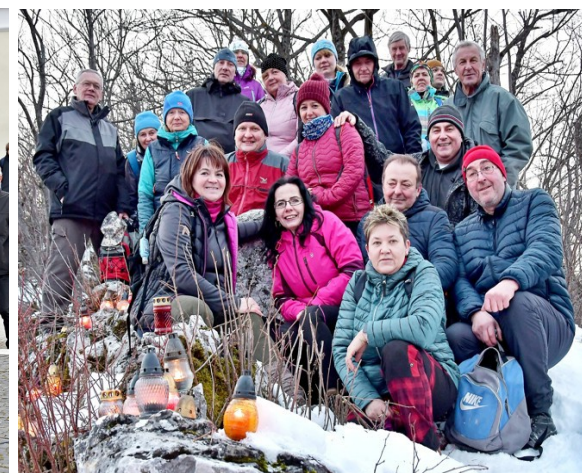
Spomienkový výstup na Hradovú