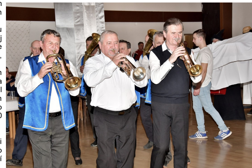
Pochovávanie basy v MskS 10. 2. 2024

Tisovský mesačník – mestské noviny občanov Tisovca a Rimavskej Pily. Vychádzajú 12 – krát do roka.