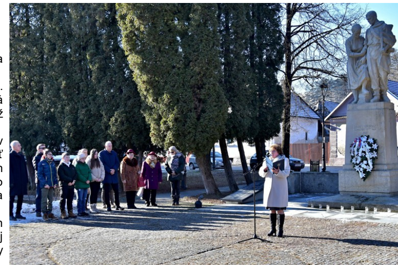
Pripomenka oslobodenia - 29. 1. 2024